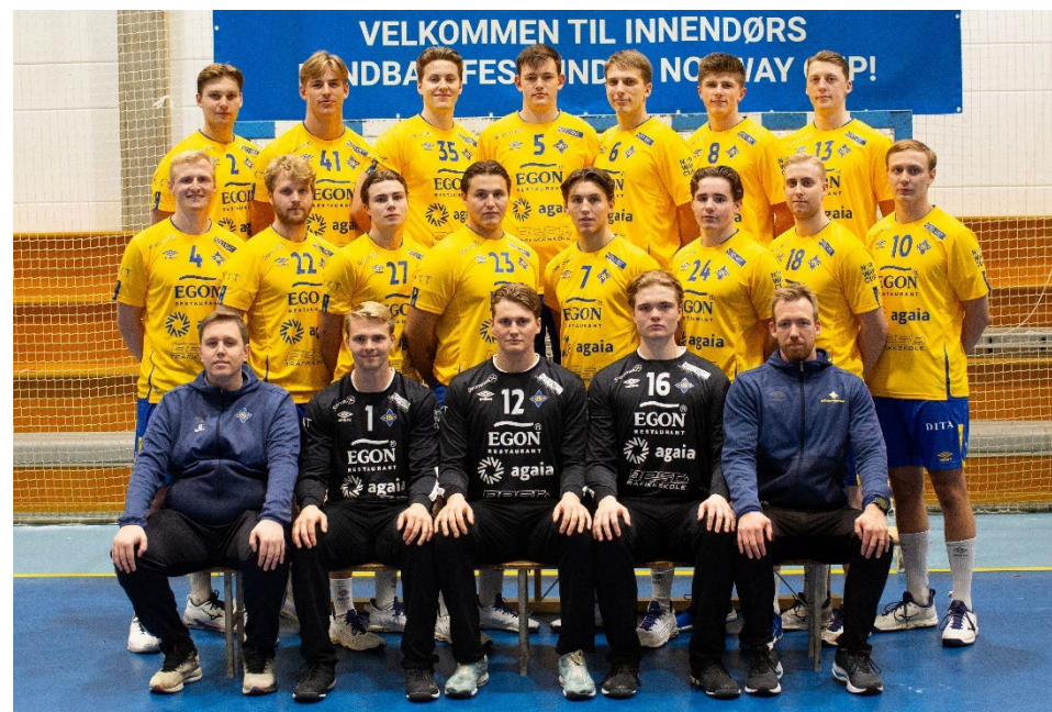
REMA 1000-ligaen menn, Håndballsesongen 2024/2025

De øvrige seniorlagene, MS2 og MS3 ligger på sikre plasser midt på tabellene og utgjør de nødvendige rekruttlagene for herrelaget. Lagene betjenes hovedsakelig av G20 og de yngste spillerne på Herrelaget.